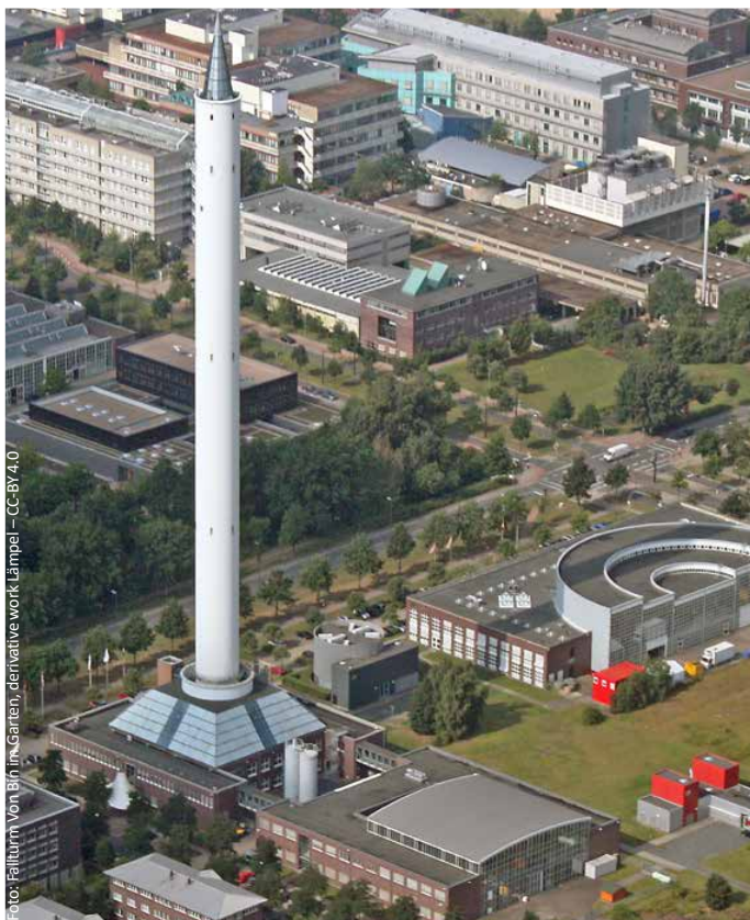
Foto: Fallturm Von Blin im Garten, derivative work Lämpel – CC-BY 4.0

Wann – und wo – hält der erste Zug an der Bremer Universität?